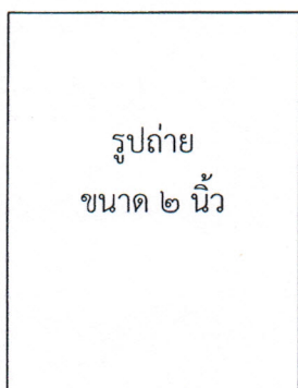
รูปถ่ายเจ้าของประวัติ