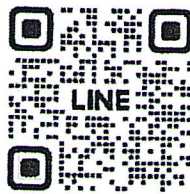
งานเครื่องราชฯ ปค.