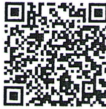
สิ่งที่ส่งมาด้วย