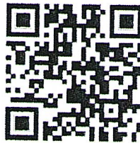
ระบบงานขอรับพระราชทานฯ